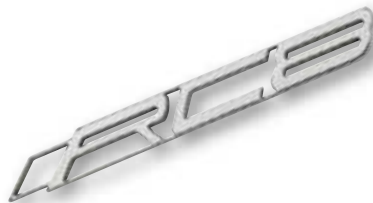
316 RC8 KEYHOLDER ..... Edelteil aus Edelstahl für edles Teil: Schlüsselanhänger für die RC8. Premium keyholder made of premium stainless steel for a premium bike: Keyholder for the RC8. ..... ART.-NR: 3PW087040