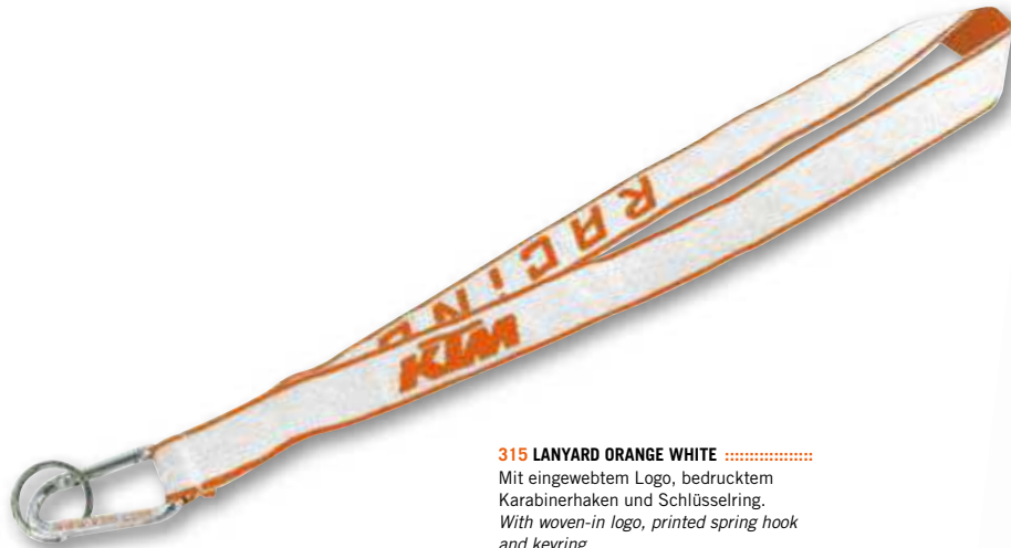
315 LANYARD ORANGE WHITE ..... Mit eingewebtem Logo, bedrucktem Karabinerhaken und Schlüsselring. With woven-in logo, printed spring hook and keyring. ..... ART.-NR: 3PW097110