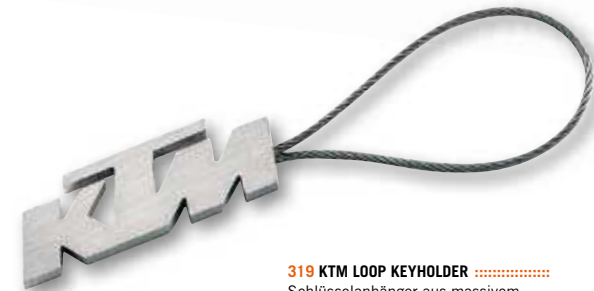
319 KTM LOOP KEYHOLDER ..... Schlüsselanhänger aus massivem, 5 mm starkem V2A Edelstahl. Schlüsselbefestigung mittels Edelstahl-Madenschraube M4. Logo-Breite ca. 45 mm. Keyholder in massive, 5 mm V2A stainless steel. Key montage with stainless steel grub screw M4. Breadth of logo approx. 45 mm. ..... ART.-NR: 3B57230