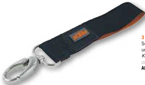
317 KEYHOLDER PIN ..... Schlüsselanhänger mit Karabinerhaken und Logo-Pin. Keyholder with spring hook and logo pin. ..... ART.-NR: 3PW097140